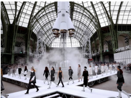
Le Grand Palais

Plusieurs lieux dans tout Paris ont été choisis par les créateurs. La Tour Eiffel a été très convoitée. On y retrouve des lieux culte de la culture Parisienne comme Le Grand Palais, Le Louvre.