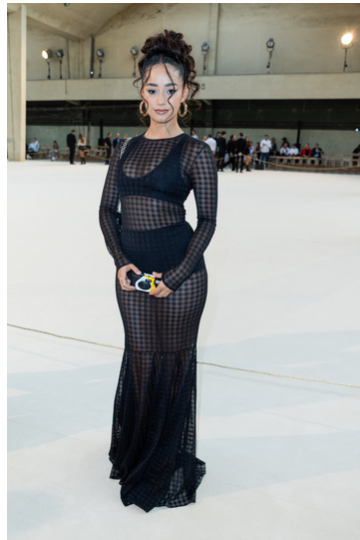
Lena Mahfouf - Influenceuse française