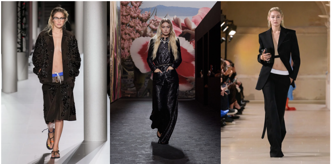
Gigi Hadid, sœur aînée de Bella Hadid, avec sa polyvalence et son charme, qui est susceptible d'ajouter une touche de glamour distincte aux défilés auxquelles elle a participé.