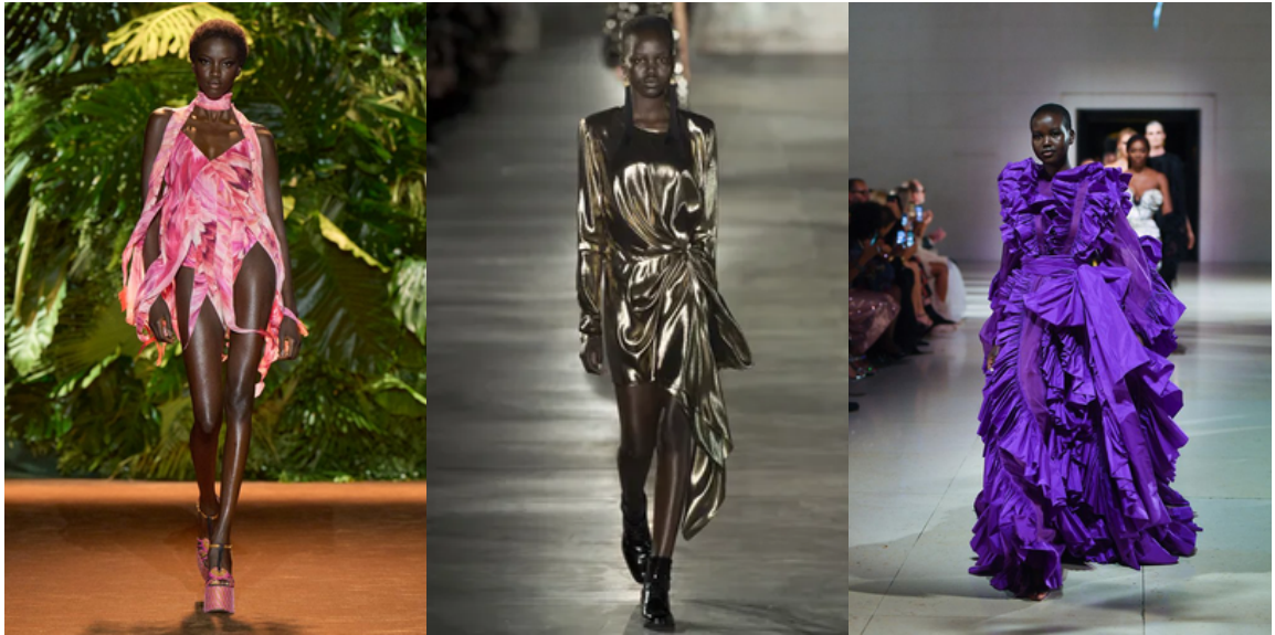
Adut Akech, mannequin d'origine Sud-Soudanaise, portant avec elle une aura captivante et un parcours exceptionnel.